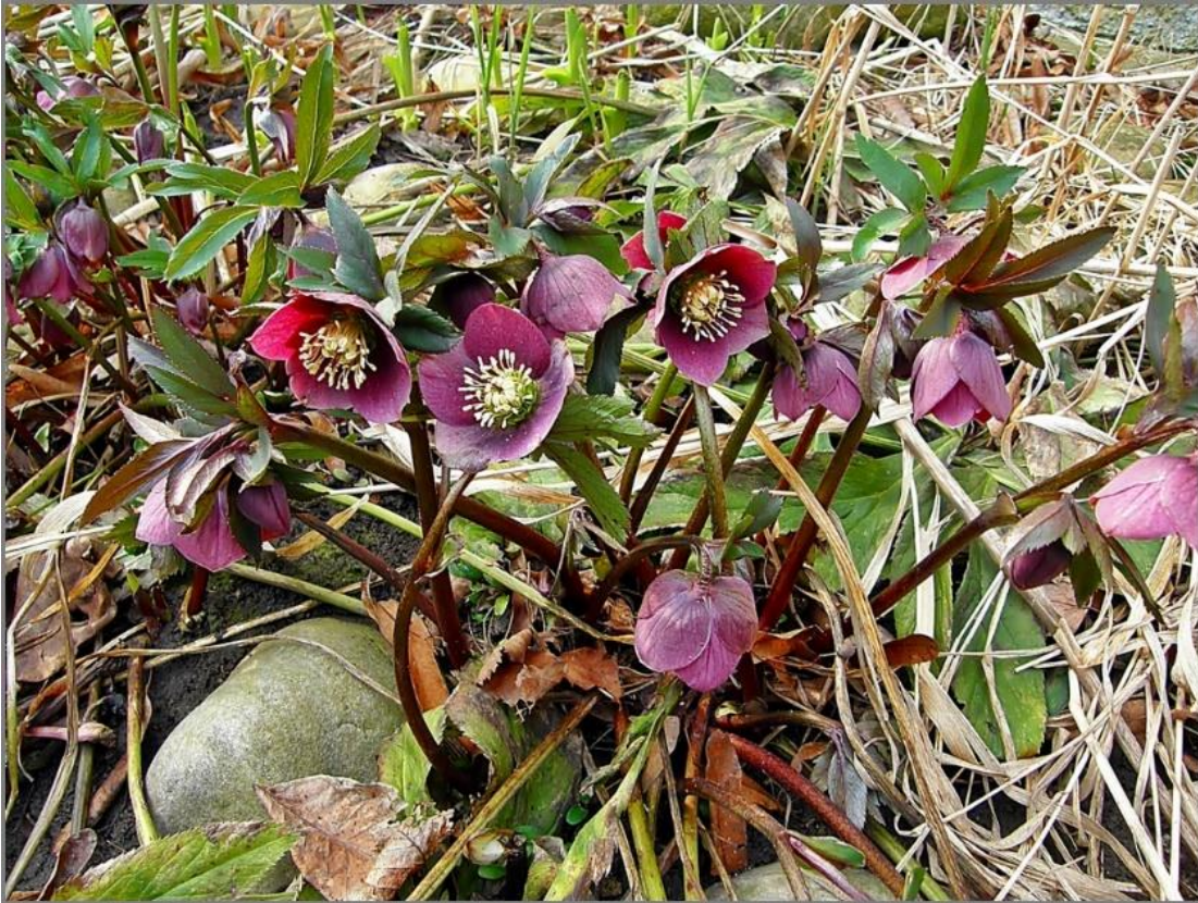
Helleborus purpurascens – ingerterápia, 'paponya' Erdélyben (a rhizoma „kiteljesedése”)